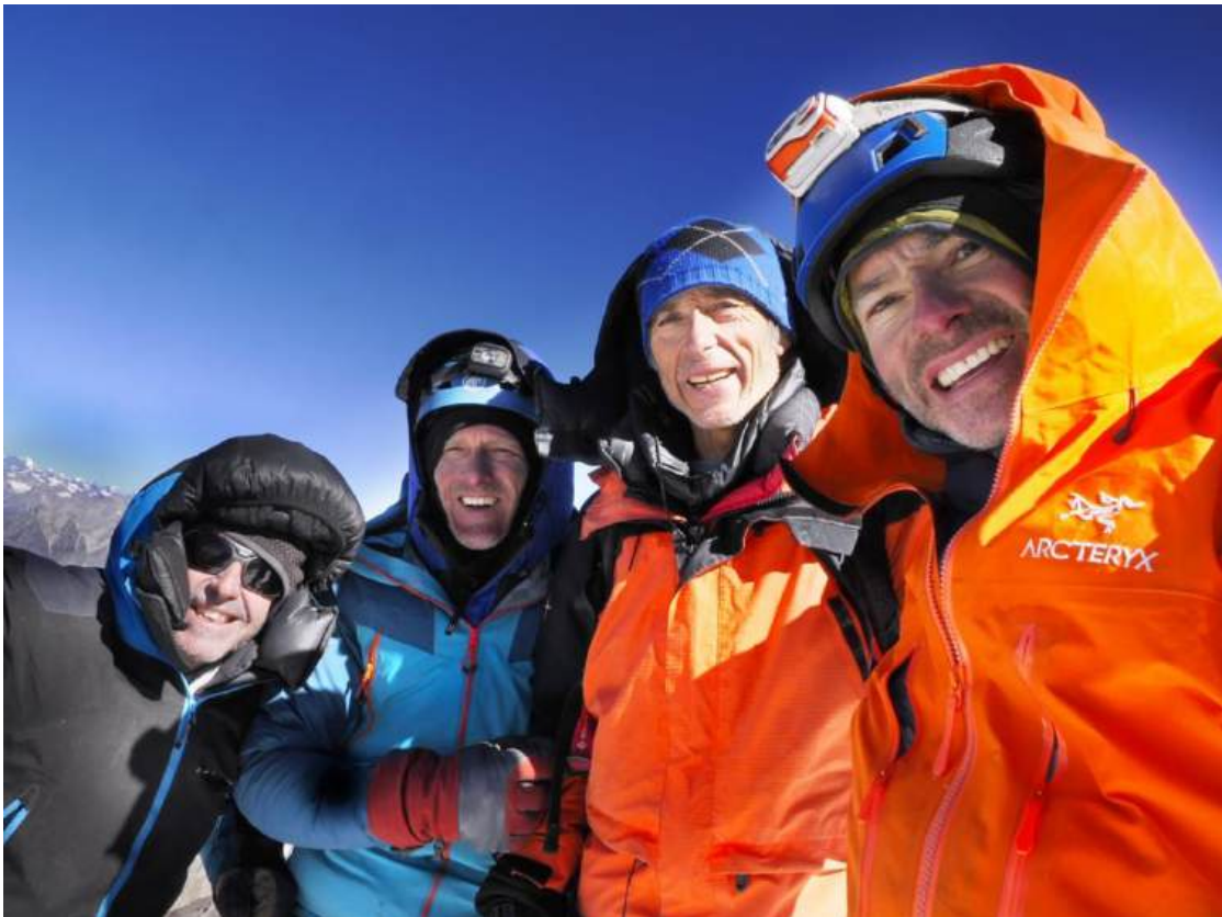
Foto de cumbre de los componentes