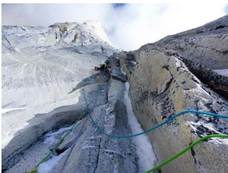
Rubén escalando en mixto en la escocesa

El día 27, desmontamos el campamento de hamacas y seguimos bajando con todo hasta el campo avanzado.