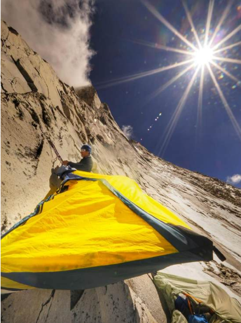
Mikel en el segundo campo de hamacas

Estilo Cápsula, con cuerdas fijas 400m, con Estilo Alpino non stop 43 horas.