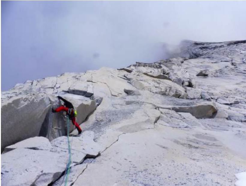
Chemari en la ruta alemana