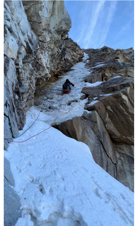
Figura 1: Segundo largo

Dos largos más de mixto muy buenos y salimos prácticamente en la cima del Huamashraju.