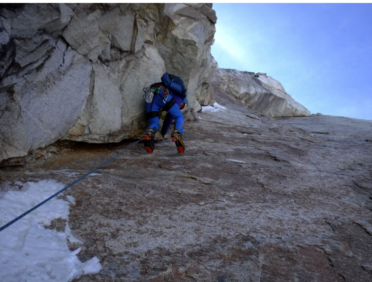
Figura 2: Cuarto largo

Al empezar el cuarto largo no seguimos bien el croquis y tiramos recto por un diedro totalmente seco, enlazando con la línea original en el quinto largo.