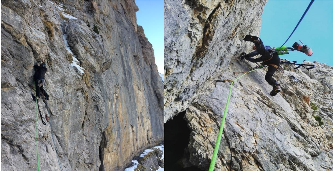
Primer largo y segundo largo (M8).