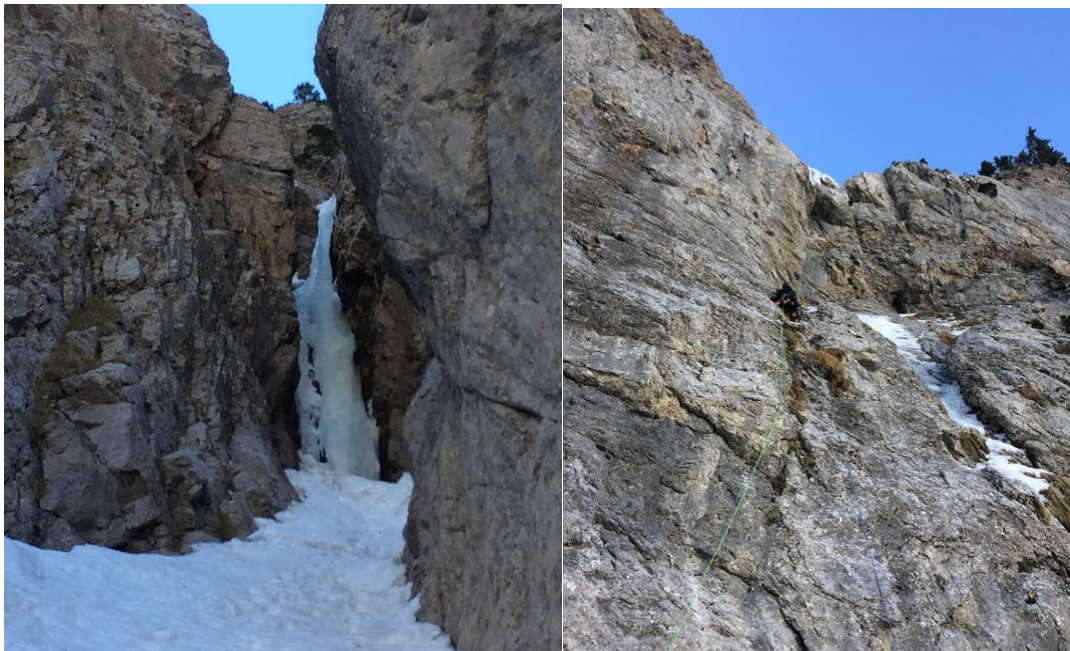
Largo de hielo de 4 grado y comienzo de la via