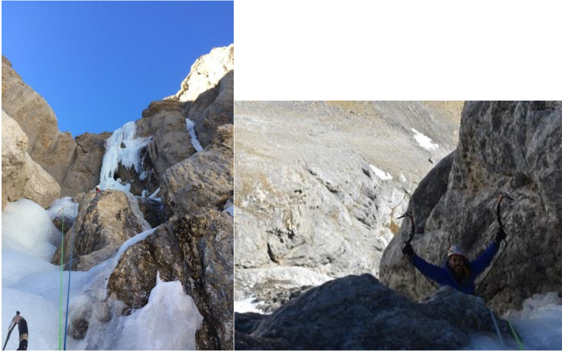
Base del churro y foto de posturo.