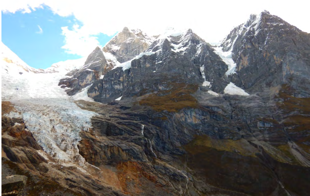
PANORÁMICA DEL SIULA GRANDE Y DE LOS JRAUS