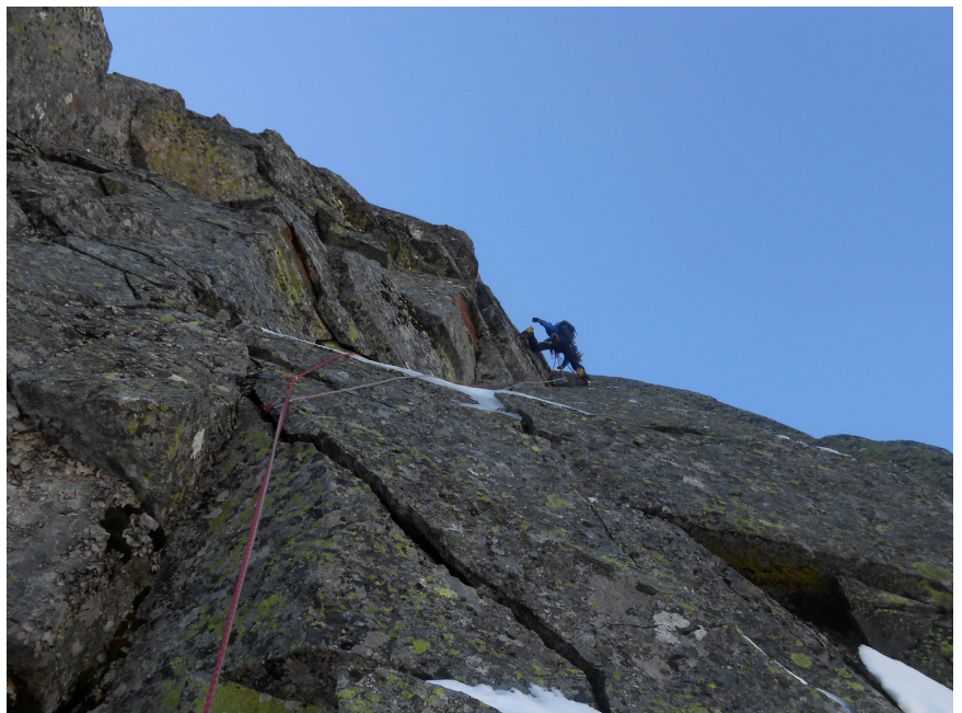
Mixto fino en el cuarto largo