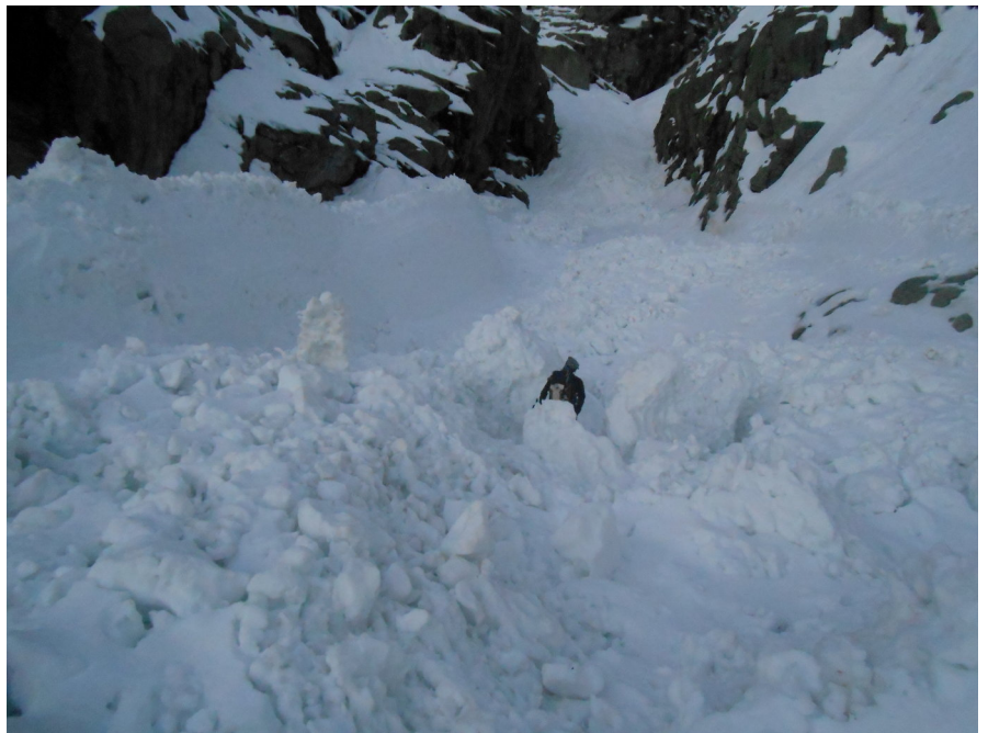
Restos de avalanchas durante la aproximación

Las temperaturas eran lamentables no había helado y estábamos a unos 8 grados. Comenzamos a escalar la plancha delicada de hielo del primer largo que estaba hueca, despegada y chorreando, nos la estábamos jugando... tuvimos que abandonar y abrimos a la izquierda de la pared una línea más sencilla sin peligro objetivo: Condiciones obsesivas 250,MD-, (AI3+, M4+).