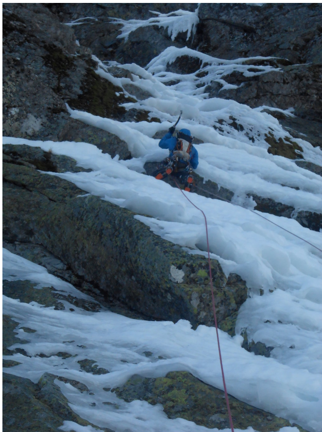
Placas de hielo en el primer largo

Tras el frente de calor, venía un día de ventisca en el que las temperaturas bajaban débilmente de 0° durante 24 horas. Seguido venía otro frente de calor. Teníamos que escalarlo justo en ese intervalo. El día anterior estuvimos observando los datos de las estaciones meteorológicas próximas de día y de noche, a todas las horas del día, la línea se convirtió en una obsesión. En cualquier momento desaparecería.