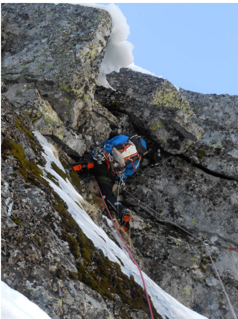
Desplome del tercer largo

El mes de Marzo de 2017 fue el mes de Marzo más caluroso de la historia, desde que hay registros.